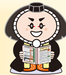
小松市イメージキャラクター「カブッキー」